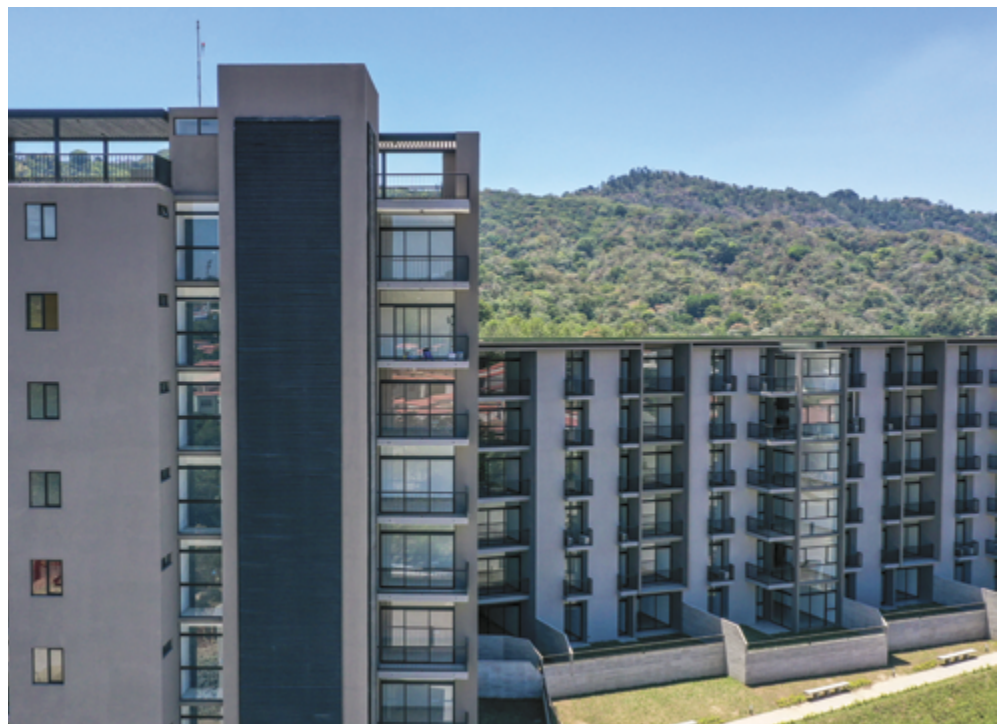
Condado Santa Rosa

El Concreto Súper Fluido Premium ha sido adaptado para un desempeño con mayor exigencia, superando los estándares para los concretos convencionales y medido a través del ensayo de extensión.