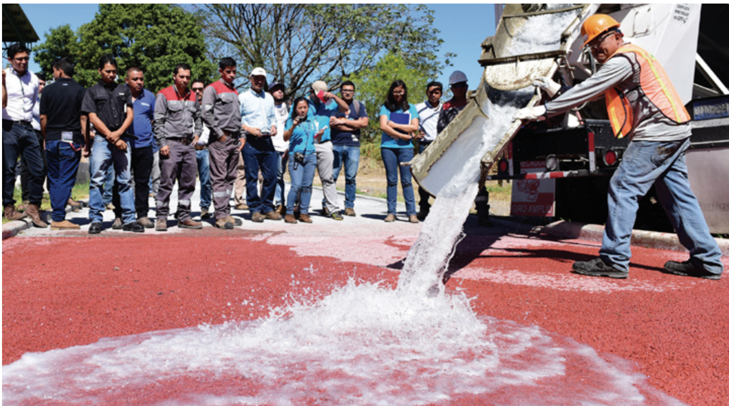
Pruebas hechas con concreto permeable.

Se puede utilizar en todo tipo de estructuras en las que se encuentren limitaciones de espacio, tiempos cortos de colocación y restricciones de ruido.