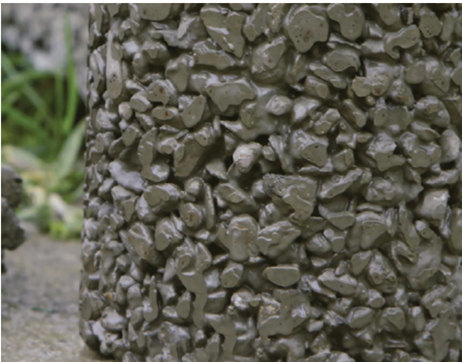
Cilindro de concreto permeable.

Es necesario que el diseñador considere los requisitos del ACI 522, con relación al mantenimiento de las estructuras.