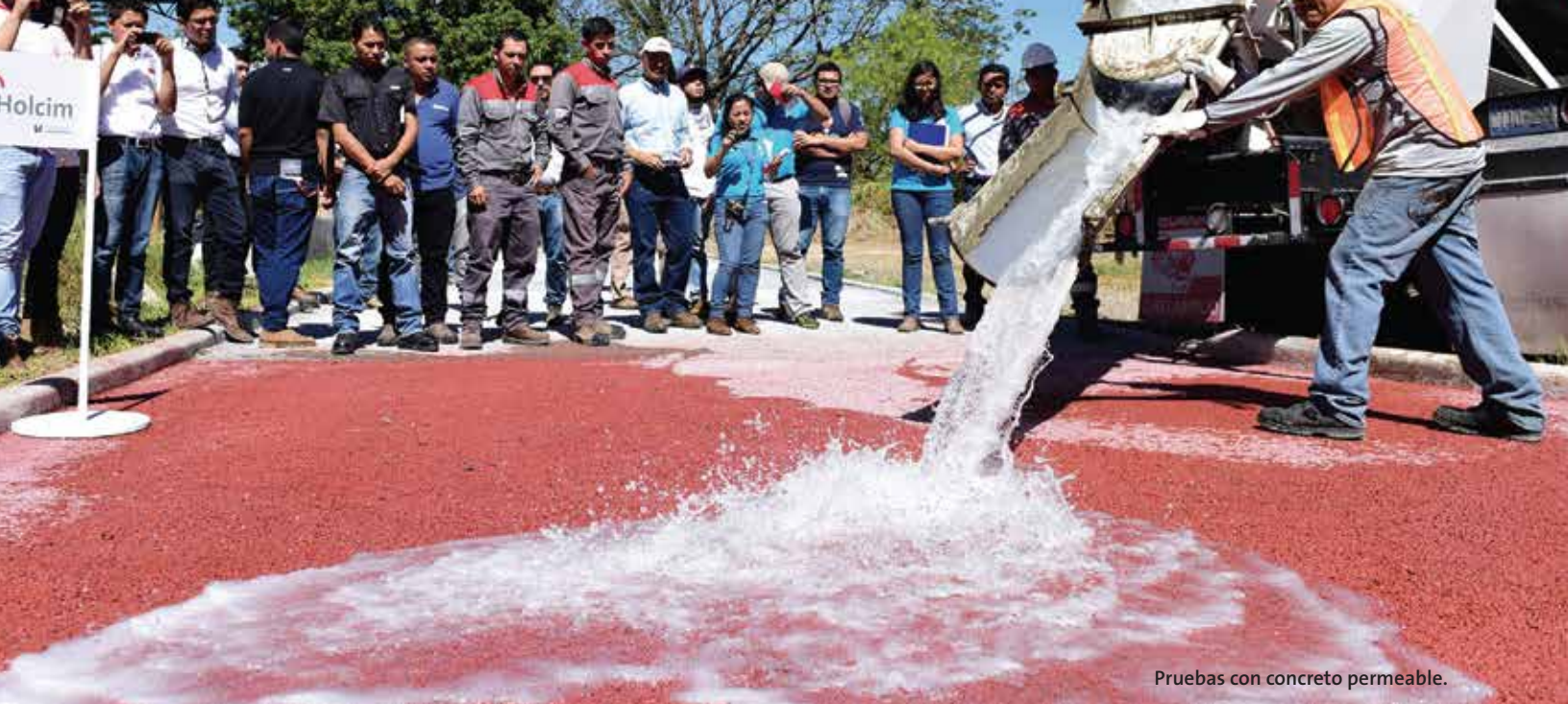
Pruebas con concreto permeable.