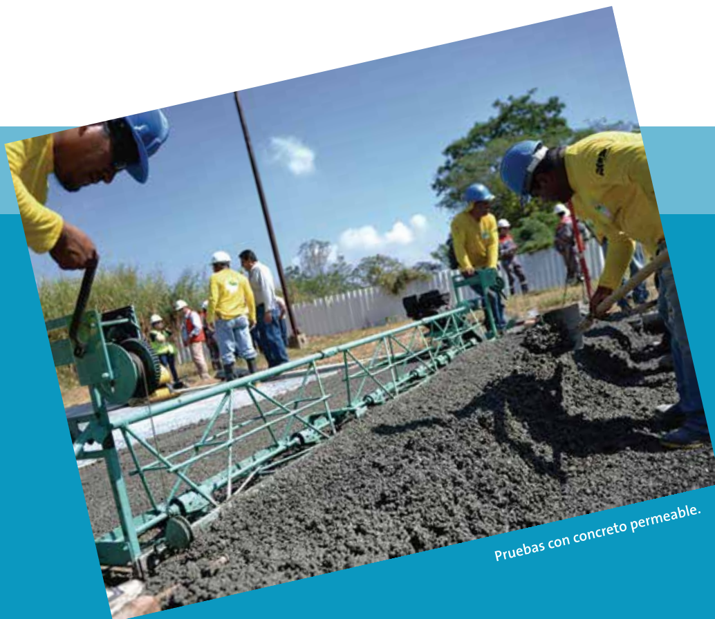
Pruebas con concreto permeable.